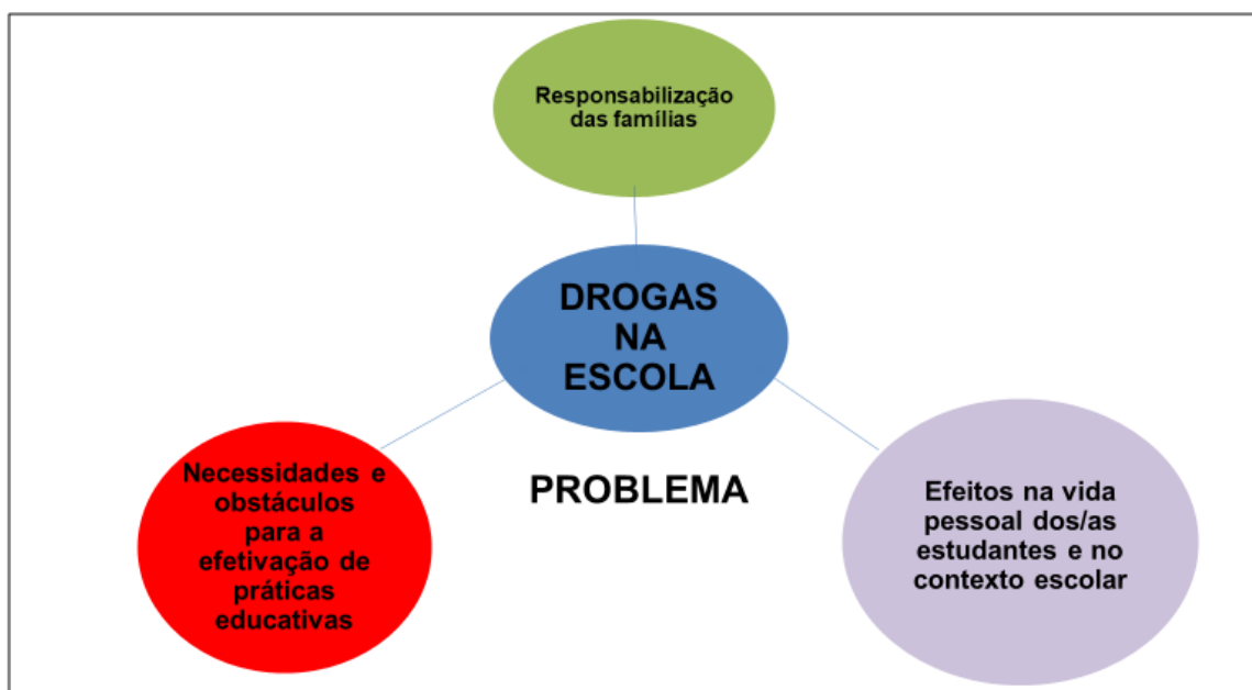
Figura 2. Drogas no contexto da Rede Estadual de Ensino em Campina Grande/PB