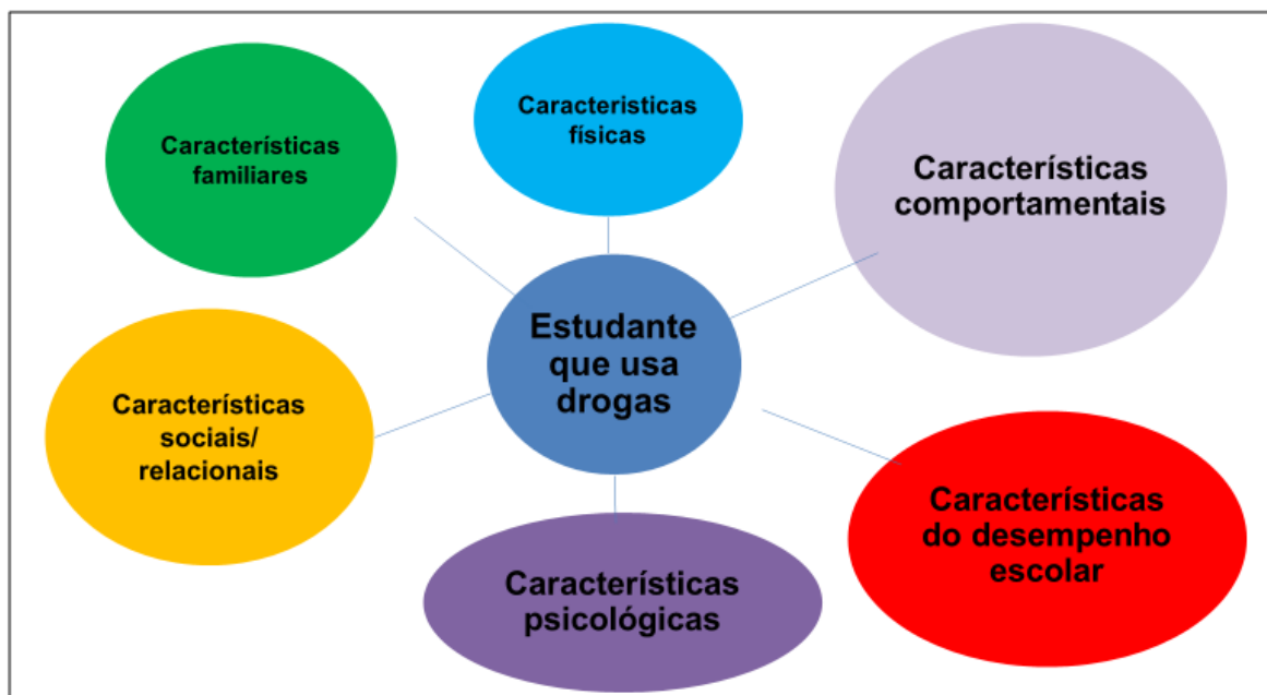
Figura 4. Características dos/as estudantes que usam drogas